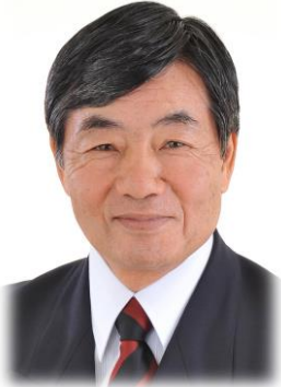
稲嶺 進氏 名護市長