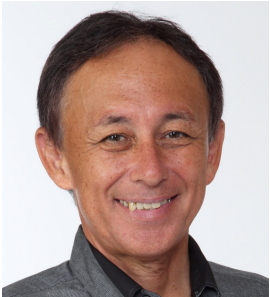
玉城 デニー 氏 たまき でにー 沖縄県知事

沖縄県知事。上智社会福祉専門学校卒業後、中部地区老人福祉センター職員やラジオパーソナリティを経て2002年より沖縄市議会議員（1期）、2009年より衆議院議員（4期）を務める。2018年9月の沖縄県知事選挙にて当選、2022年9月の同選挙にて再選。座右の銘「天は正論に信念と勇気を与える」。